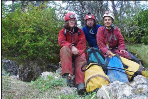
Après 11 heures sous terre, l'extraction des kits du Puech Nègre"