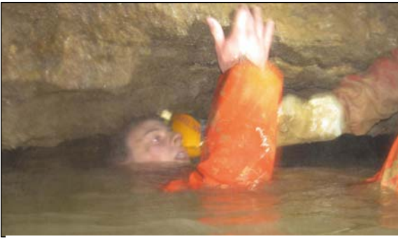
La photo n'est pas de grande qualité, mais c'est de la « première » !

constatant que le passage semi noyé semble court, franchit l'obstacle suivi de Paul C. Mais, laissons parler les acteurs principaux de cette aventure.