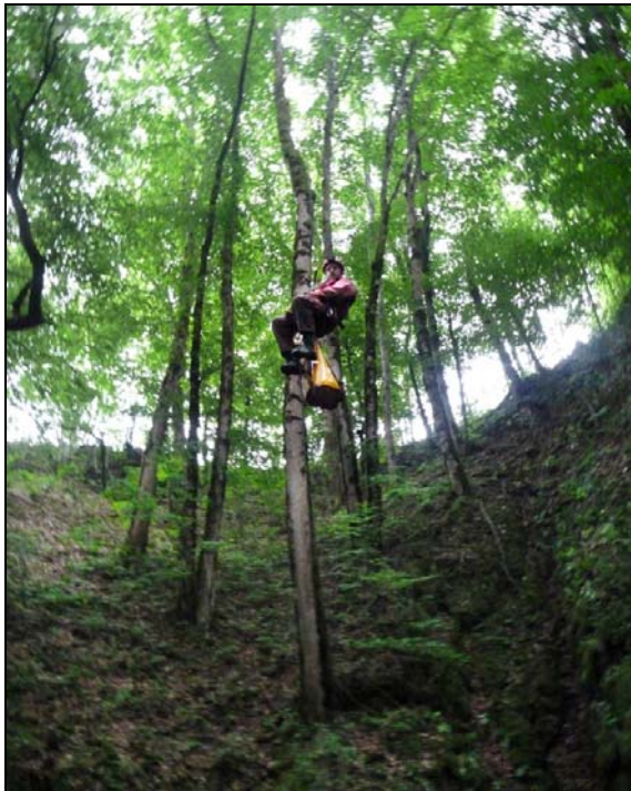
Départ de la tyrolienne à la Baume Ste-Anne