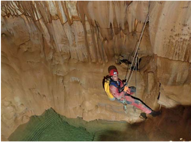
C'est sympa du point de vue technique pour y accéder mais cela ne donne rien.