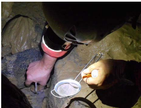
Chasse aux niphargus dans la grotte de la Bramette