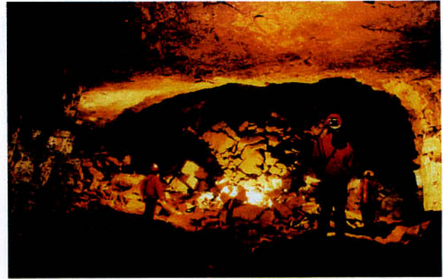
La Borne aux Cassots.