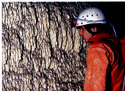
La Borne aux Cassots

Peu de temps après l'alerte, le plan de secours souterrain fut activé et le Spéléo Secours Suisse alerté se tenait à disposition via la Rega. La réquisition des dijonnais ainsi que de gros moyens de pompage allaient permettre de reconnaître les différents siphons et de rechercher d'éventuelles cloches d'air susceptibles d'abriter les huit disparus. Parallèlement à cette action, plusieurs équipes de désob tentaient la jonction "Entrée Supérieure" - "Salle des Inscriptions", lieu où reposait l'espoir de retrouver les victimes. Pourtant les recherches restèrent vaines et la grotte de Bief Paroux réputée pour ses spectaculaires "mises en charge" ne laissait que peu de chances de retrouver les apprentis spéléos vivants. Mais c'est sur les indications de Jean-Claude Frachon qui fournissait de surcroît une topo précise de la cavité que l'espoir revint. Une première équipe du Jura fut réquisitionnée le jeudi soir (3 personnes) et une dizaine de sauveteurs furent mis en pré-alerte.