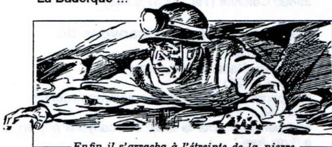
— Enfin il s'arracha à l'étreinte de la pierre. —