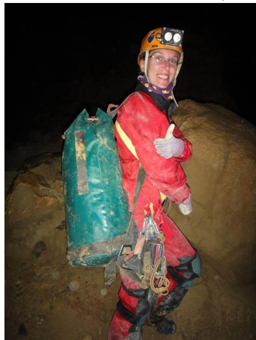
Photo : le premier "trash-kit" au départ du Camp des Etrangers à -1050