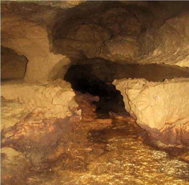
Physionomie des galeries nouvellement découvertes

un court instant pour entrevoir un accès vers un réseau supérieur au courant d'air très prometteur. Quelques mètres plus loin, un siphon marque le terminus de cette galerie qui s'oriente dans la direction Nord-Ouest.