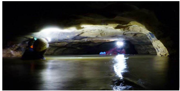
Dans les voutes mouillantes de la galerie des Zipos

L'été 2015, caractérisé par sa période d'étiage prononcé, aura permis quelques incursions dans cette cavité au caractère capricieux et réfractaire. Pas de nouvelles découvertes mais une séance topographique aura permis de mieux interpréter un secteur mal connu de la grotte : La "Galerie des Zipos". Découverte en octobre 2009 au-delà d'une voute mouillante d'une vingtaine de mètres, ce conduit semble constituer l'extrême amont de la grotte. En effet, les quantités d'eau impressionnantes qui jaillissent de l'entrée en périodes de crue ne peuvent provenir que de là. Le terminus est toutefois obturé hermétiquement par un bouchon de sable. Un sable calibré qui forme un plancher régulier comme celui d'une plage ainsi que quelques dunes qui changent de formes et de places au gré des visites. Différentes observations tendent à prouver que cette masse de sable est tantôt refoulée lors des fortes montées d'eau puis aspirée vers le terminus avec le reflux du courant.