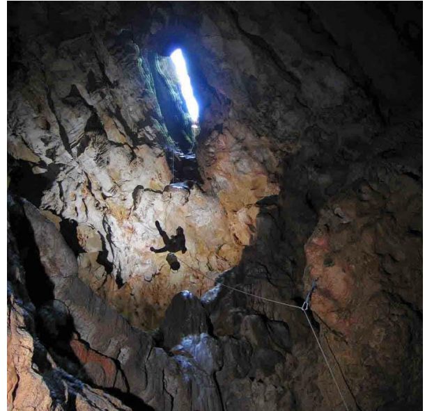
Aven de la plaine des Gras

Afin de rompre un peu la routine karstique jurassienne, nous sommes allés parcourir quelques cavités dans le sud : Traversée Aven Despeysson-Saint-Marcel, Aven de la plaine des Gras, Aven des Pèbres, Grotte nouvelle de Vallon Pont d'Arc, quasi traversée de la Cocalière. Quelques surprises plus ou moins heureuses nous attendaient comme le verrou totalement grippé de la porte de la