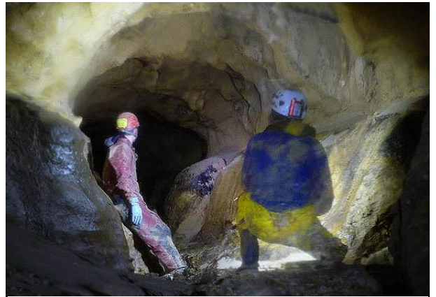
La galerie des Zipos vers son terminus

Le même phénomène est également constaté au "Trou de la Bouche" à Arbent (01), cavité majeure (environ 4000 m) située dans le même massif, en relation démontrée avec la Source Bleue de Dortan