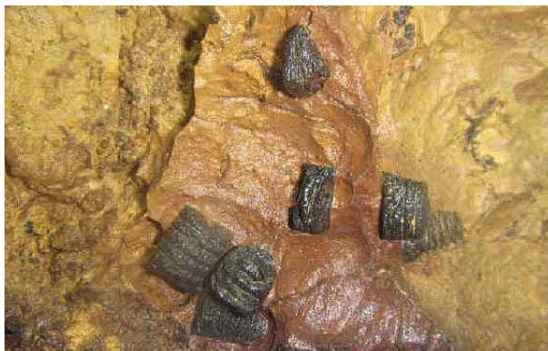
Fossiles de crinoïdes